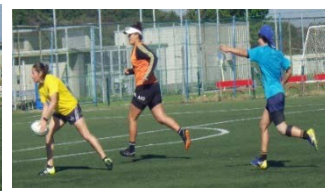
サッカーコートパスをつないで往復。常にダッシュ！