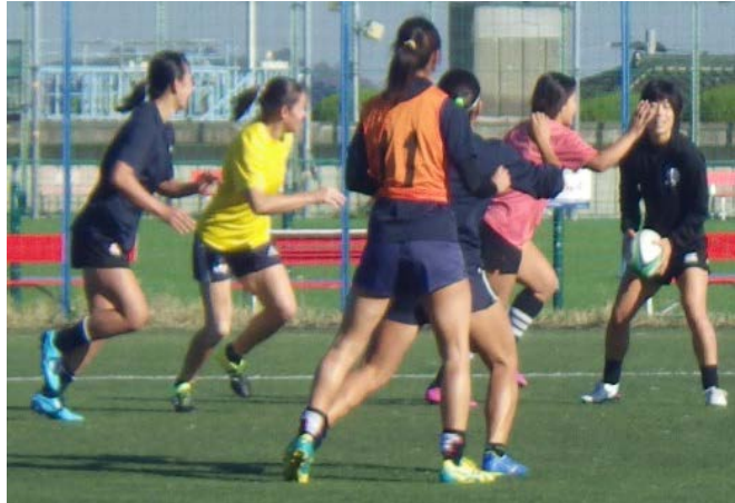
パスだけでトライを奪う。周りの選手が激しく動く

2019年横浜でラグビーワールドカップ決勝が開催されるなど、盛り上がりを見せているラグビー。そこで、先日開催されたリージョナルウィメンズセブンス2018関東大会で見事優勝を果たした戸塚生まれの女子ラグビーチーム『YOKOHAMA TKM』を取材！練習に見学・参加させていただき、インタビューにも答えていただきました！