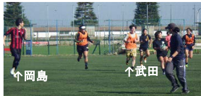
見学のつもりが練習にも参加することに。必死でしたが(笑)、楽しかった！