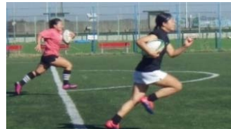
ボールを持って50mダッシュ(往復)

2019年横浜でラグビーワールドカップ決勝が開催されるなど、盛り上がりを見せているラグビー。そこで、先日開催されたリージョナルウィメンズセブンス2018関東大会で見事優勝を果たした戸塚生まれの女子ラグビーチーム『YOKOHAMA TKM』を取材！練習に見学・参加させていただき、インタビューにも答えていただきました！