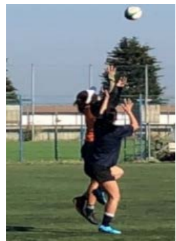
キックされたボールを競り合いキャッチ

私たちが参加させていただきましたが、ボールを持った50mダッシュ、サッカーコート往復のパスリレーなど全くついていけず、ゲーム形式のものはボールを追いかけるだけで精一杯。選手の皆さんの俊敏性やスピード、持久力などが素晴らしく、アスリートとしての輝きを感じました。