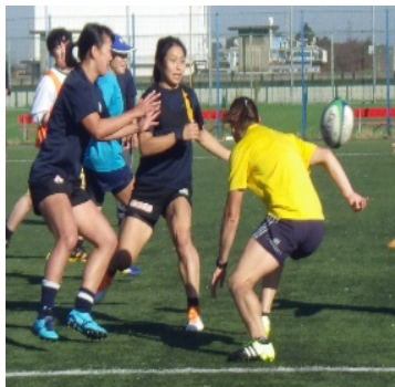
相手を振り切るためにステップ！