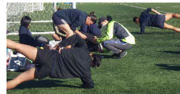
練習前のウォームアップ

オフ明けの練習ということで、アップの後はボックス・フォワードに分かれての対決でした。明るい雰囲気の中でも、楽なもの一つもなく真剣、全力です。